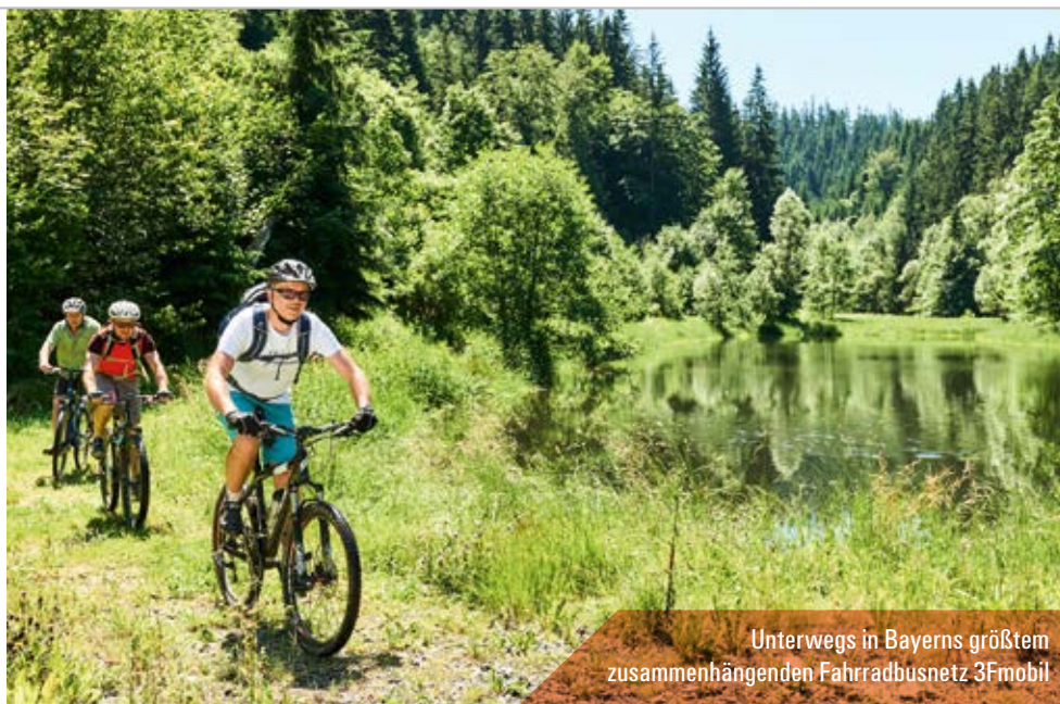
Unterwegs in Bayerns größtem zusammenhängenden Fahrradbusnetz 3Fmobil

Höllental, gehen Sie unter Tage im Besucherbergwerk Friedrich-Wilhelm-Stollen bei Lichtenberg oder entspannen Sie im natürlichen und gesunden Thermalwasser und Naturmoor der Ardesia-Therme.