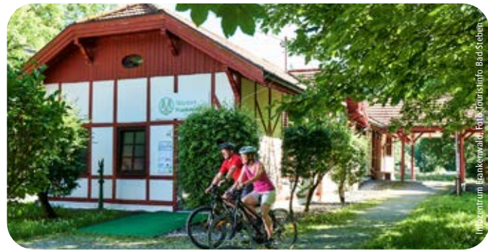
Infozentrum Frankenwald