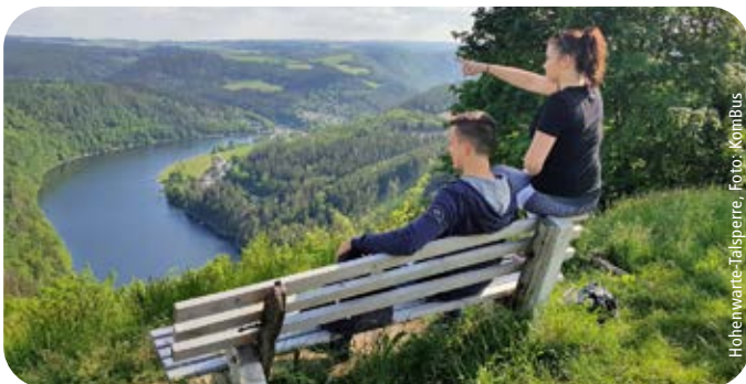
Hohenwarte-Lalsperre, Foto: KomBus

Infos: www.thueringer-schiefergebirge-obere-saale.de / www.rennsteigsaaleland.de