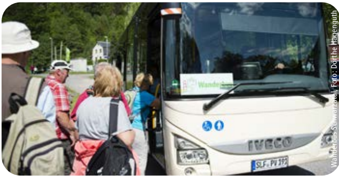
Walden bis Schwarzatal

Infos: www.rennsteig-schwarzatal.de / www.outdooractive.com