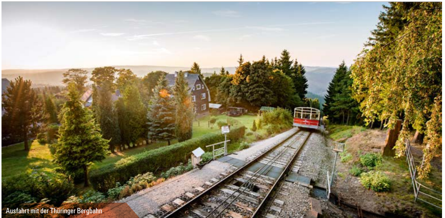
Ausfahrt mit der Thüringer Bergbahn